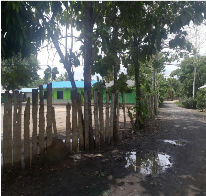
Linderos sede Reposo.