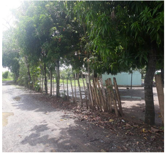
Linderos sede Reposo.

Continuar con la gestión para conseguir la ampliación de la planta de personal de la institución educativa, a fin de que se creen las plazas para el nombramiento de coordinadores, secretaria, vigilantes y auxiliares de servicios generales.