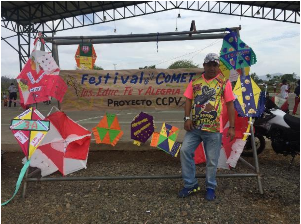
Festival de la cometa 2020