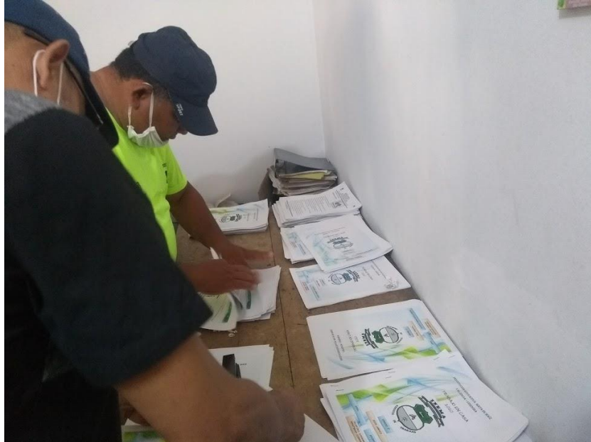
Entrega de guías.

Organización de guías por parte de los docentes.