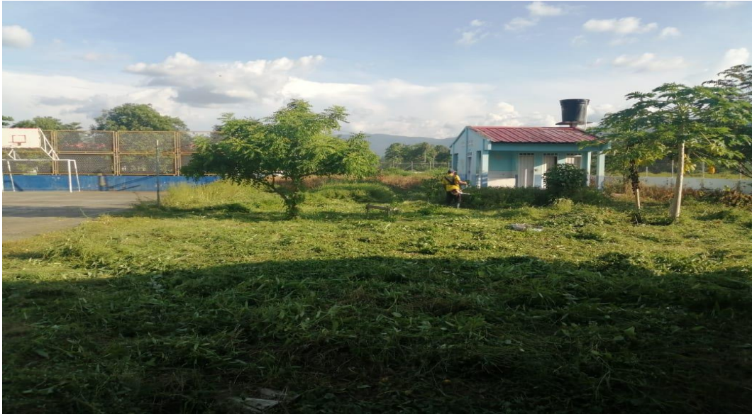
PROYECTO DE ARBORIZACION Y CONSTRUCCION DE MATERAS