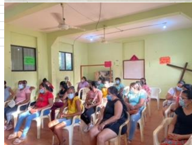
Rendición de cuentas 2021 al finalizar el año.