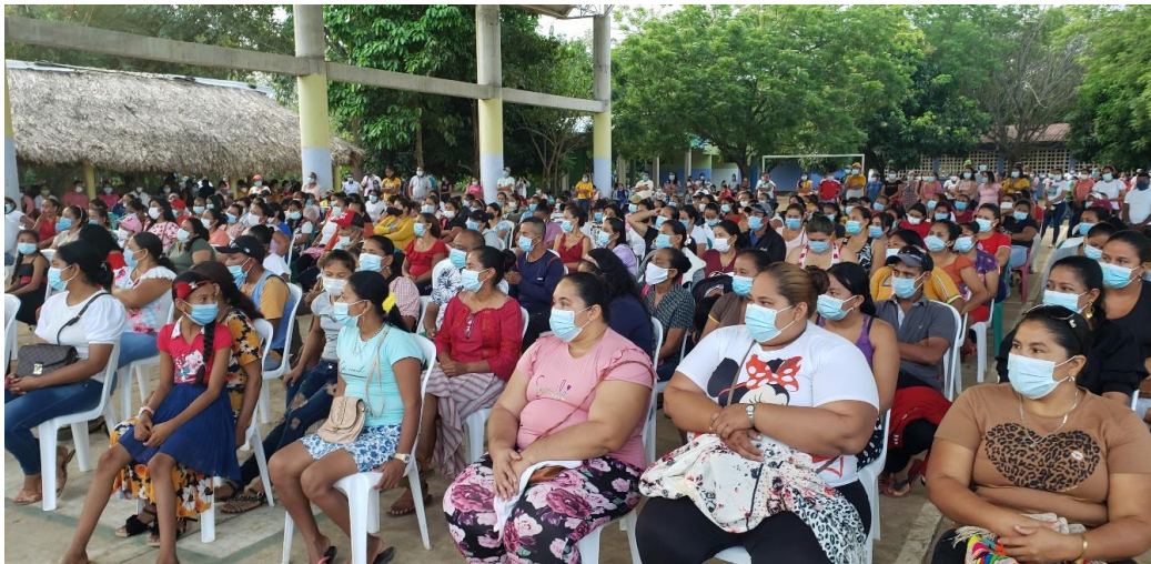
Rendición de cuenta, vigencia 20212, en sede Campamento. Febrero 11 de 2022