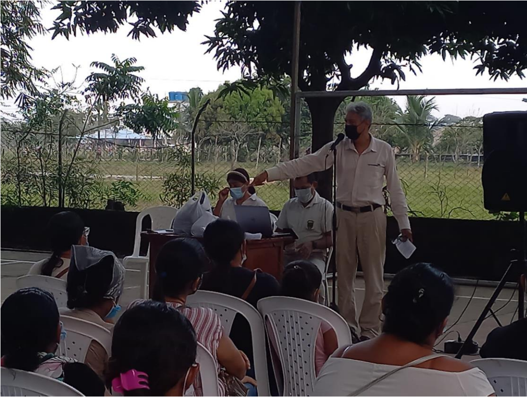
Rendición de cuenta, vigencia 20221, en sede Campamento Febrero 4 de 2022