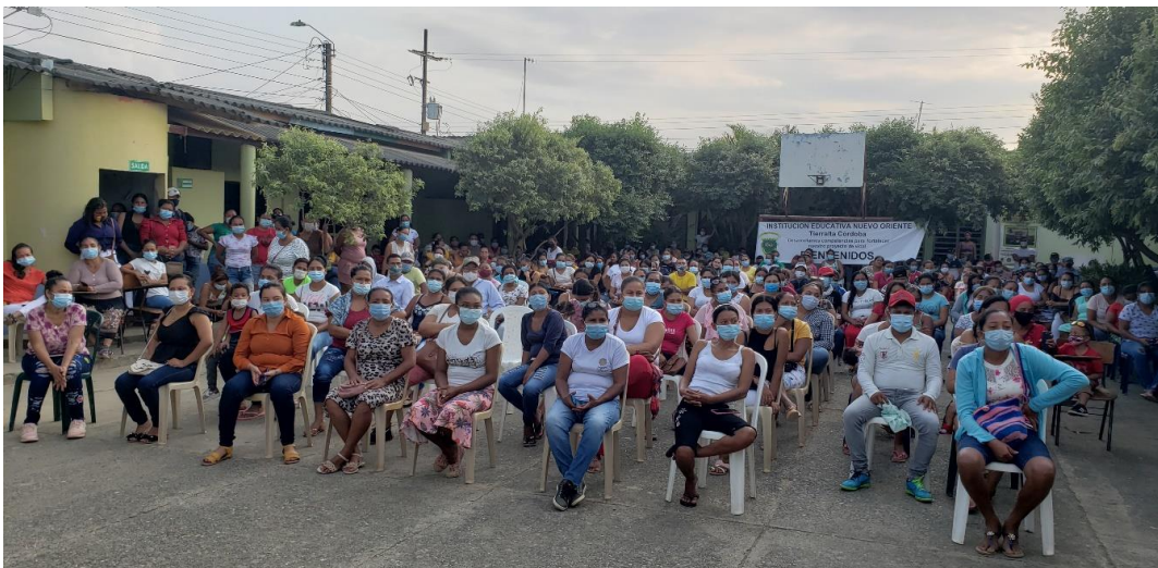
Rendición de cuenta, vigencia 20221, en sede Nuevo Oriente Febrero 4 de 2022