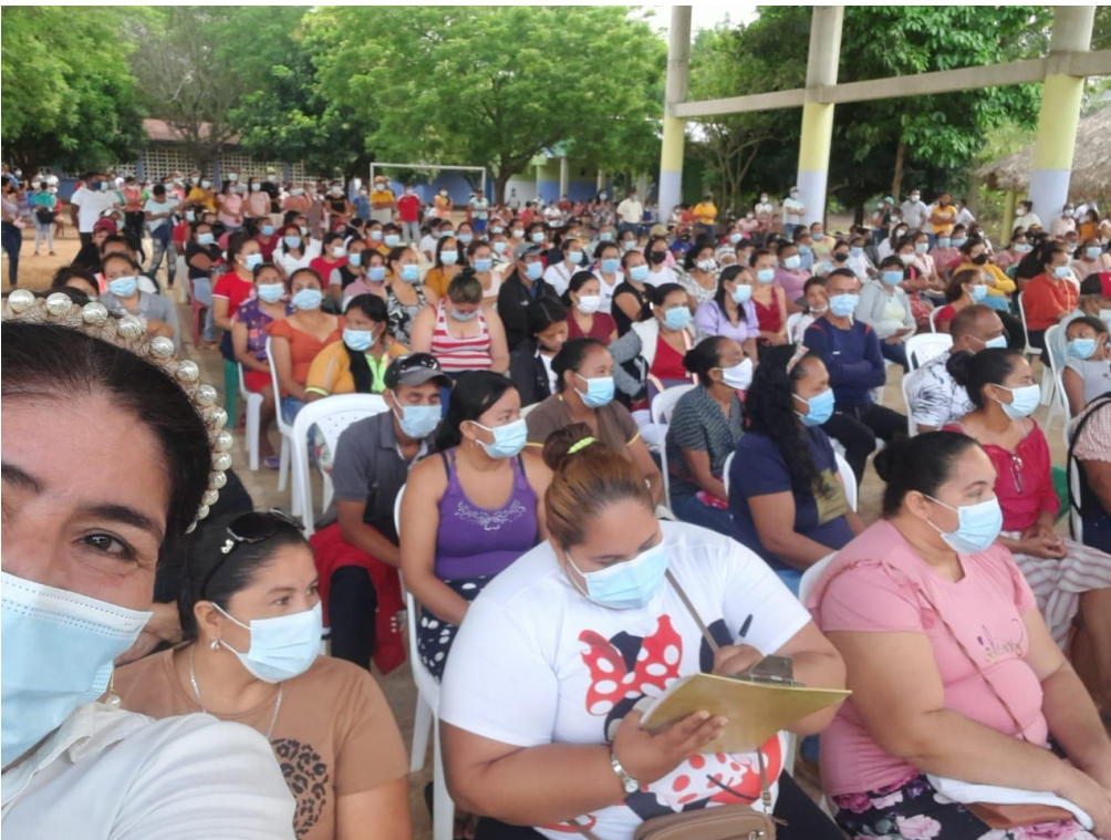
Rendición de cuenta, vigencia 20221, en sede Campamento Febrero 4 de 2022