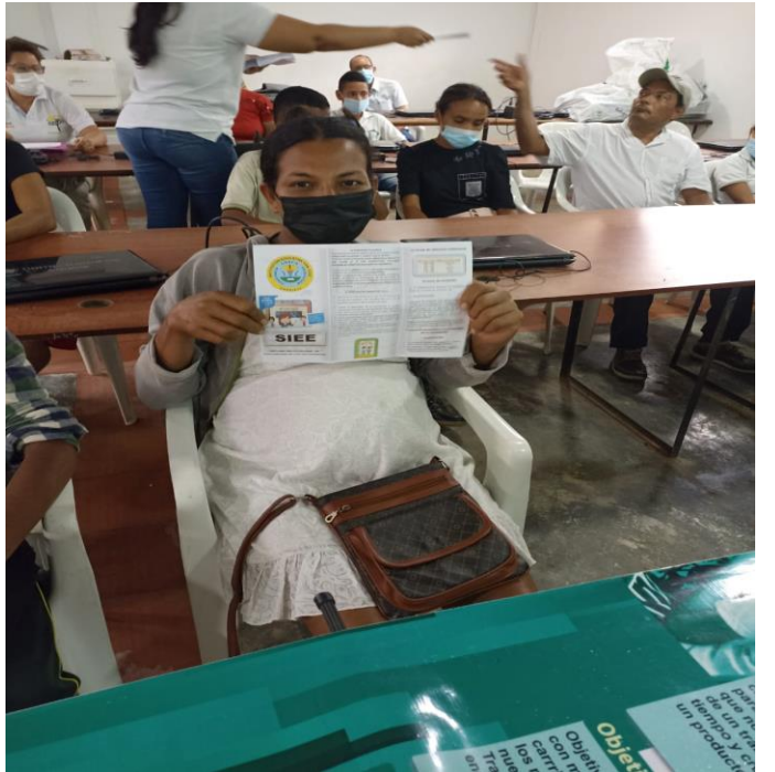
TABLERO SEDE LOS CAÑOS