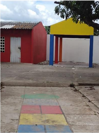
INST. ED. SAN JOSE DE CARRIZAL - SEDE PREESCOLAR